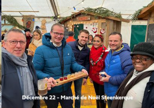
Décembre 22 - Marché de Noël Steenkerque