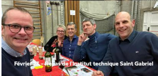
Février - Repas de l'Institut technique Saint Gabriel