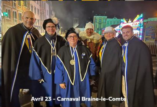
Avril 23 - Carnaval Braine-le-Comte