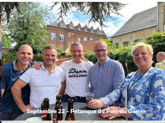
Septembre 22 - Pétanque du Parc du Gamin