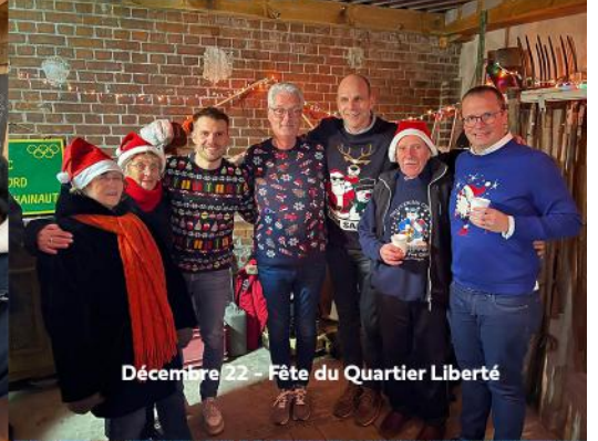
Décembre 22 - Fête du Quartier Liberté