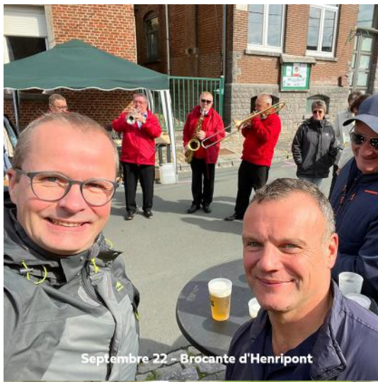
Septembre 22 - Brocante d'Henripont