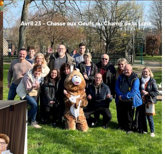
Avril 23 - Chasse aux Oeufs du Champ de la Lune