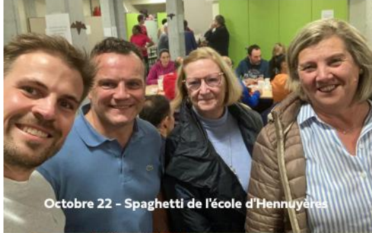
Octobre 22 - Spaghetti de l'école d'Hennuyères