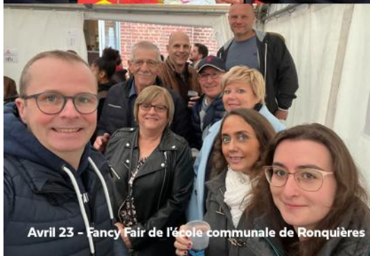
Avril 23 - Fancy Fair de l'école communale de Ronquières