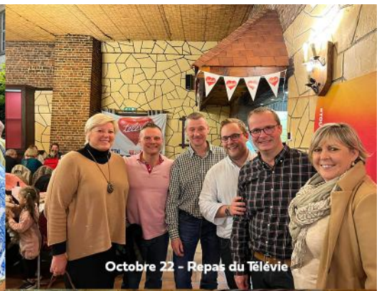
Octobre 22 - Repas du Télévie