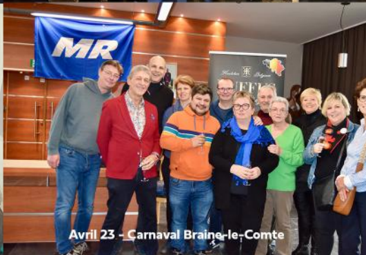
Avril 23 - Carnaval Braine-le-Comte